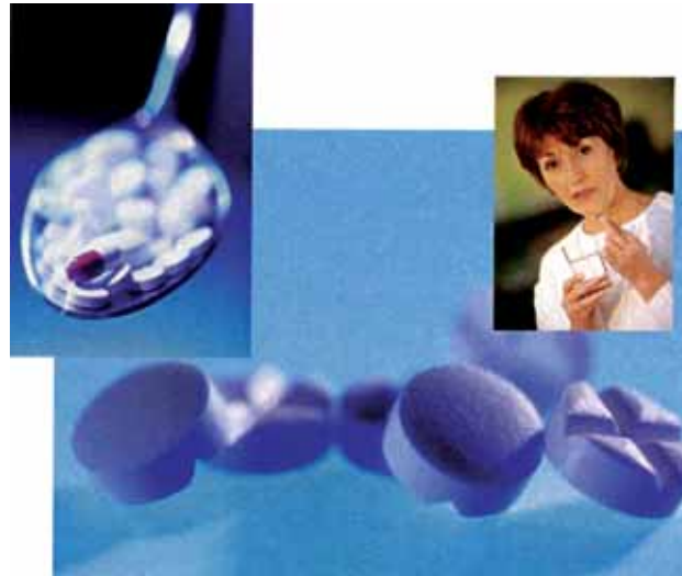
"Attention à l'automédication"

C'est la molécule qui compte, pas l'emballage.