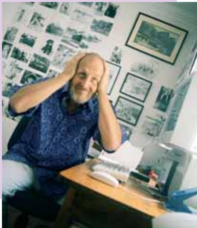
"Apprenez à comprendre le fonctionnement de votre mémoire"